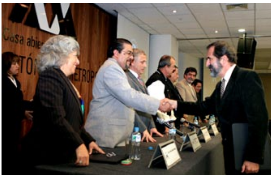
El autor de la obra es el doctor Pedro Moctezuma Barragán

“La imagen hacia el exterior y el orgullo interno son dos caras de una misma moneda y este poema es un primer