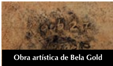
Obra artística de Bela Gold

Del 29 al 31 de octubre Tepoztlán, Morelos Mesas: Historia, Filosofía, Política, Cultura, Religión y Presencia de Giambattista Vico en Hispanoamérica dgdi@uic.edu.mx fincos8@hotmail.com Universidad Federico II de Nápoles, Italia; Universidad de Salerno, Italia; Universidad de Sevilla, España; Unidad Iztapalapa