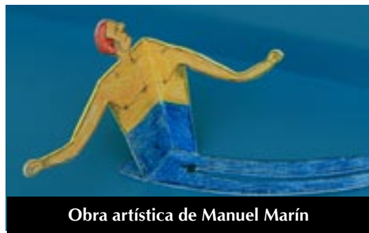
Obra artística de Manuel Marín