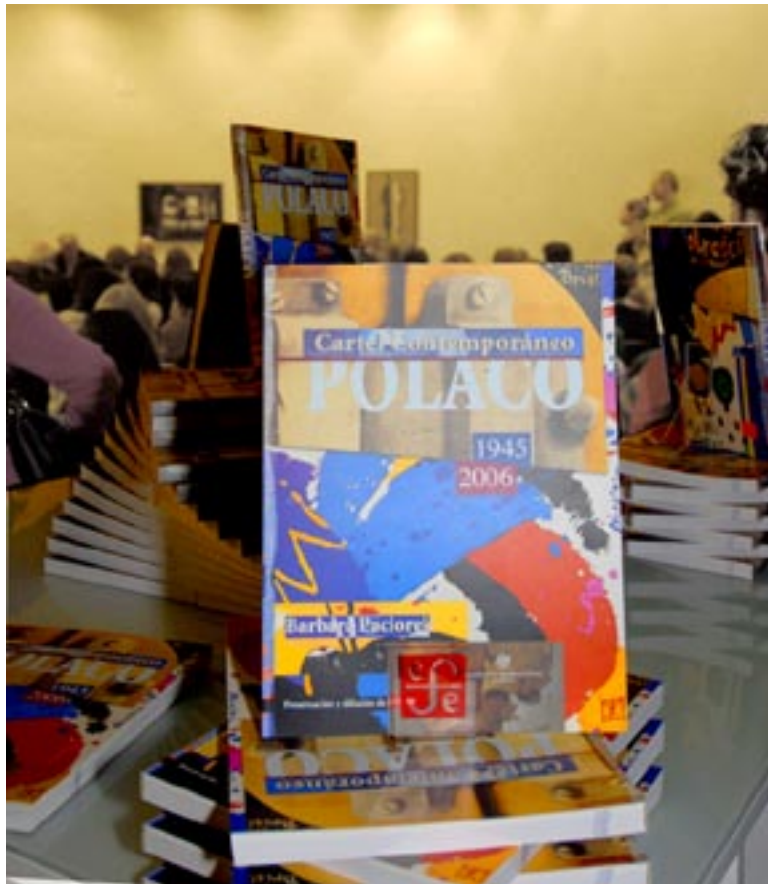
El libro-catálogo Cartel Contemporáneo Polaco 1945-2006 muestra la trayectoria y las vicisitudes de una cultura gráfica y visual forjada en la segunda mitad del siglo pasado