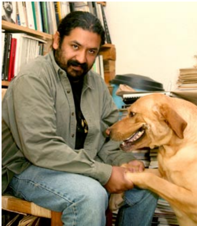
El escritor recibió el premio por su obra La mirada de los estropeados

Es editor de Pensares y Quehaceres , revista de Filosofía y columnista del diario La voz de Michoacán . Escribió la introducción y realizó la selección de textos del libro La escritura invisible . /Santiago Sánchez Cuaxospa