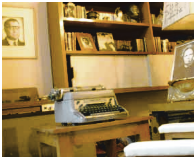
La máquina de escribir, los cigarrillos, las gafas del escritor, en la ofrenda-homenaje para conmemorar el centenario del autor de Al filo del agua

La cita es en Pedro Antonio de los Santos 84, colonia San Miguel Chapultepec, a una cuadra de la estación Juanacatlán del Metro, este jueves 28 de octubre, a las 19:00 horas. Permanecerá abierta al público hasta el miércoles 3 de noviembre. / Estrella Olvera Barragán