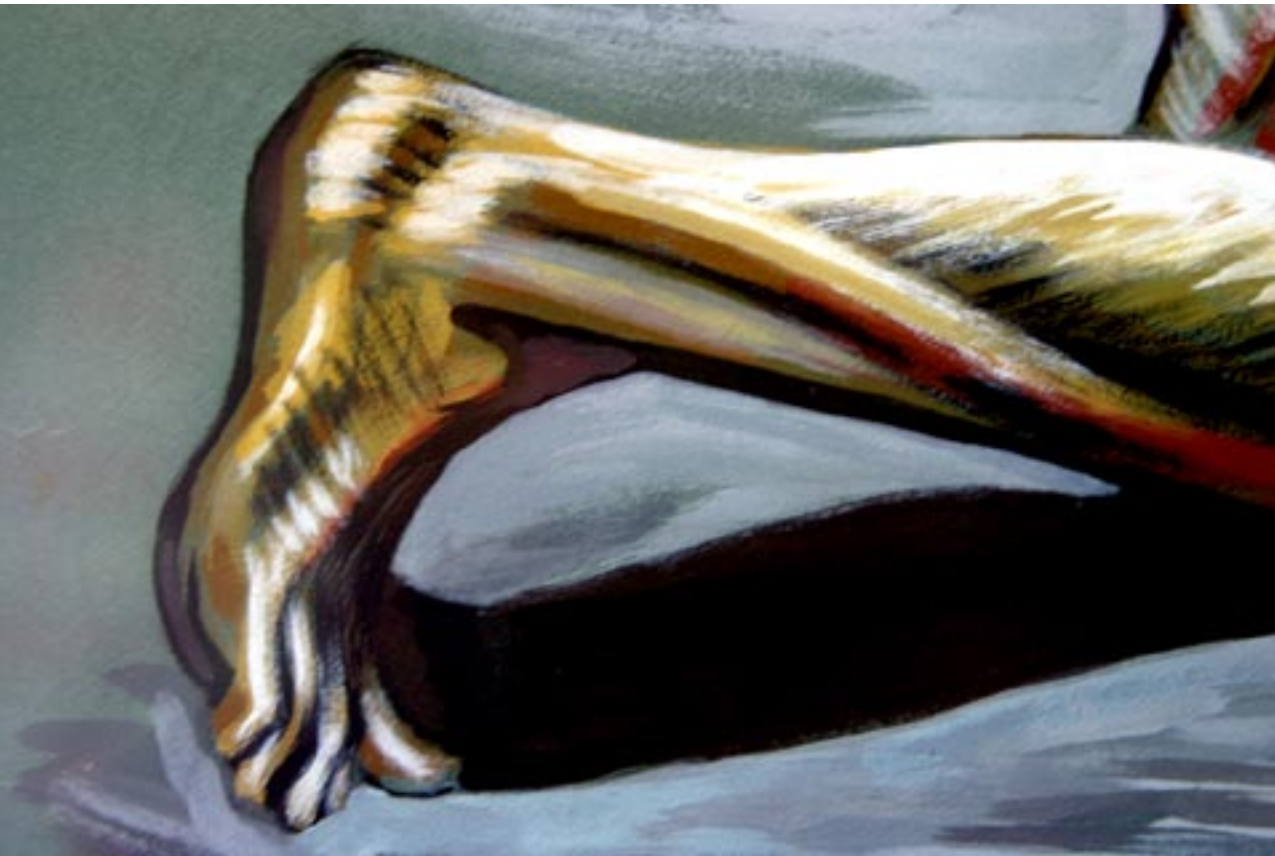
Hombre de rodillas