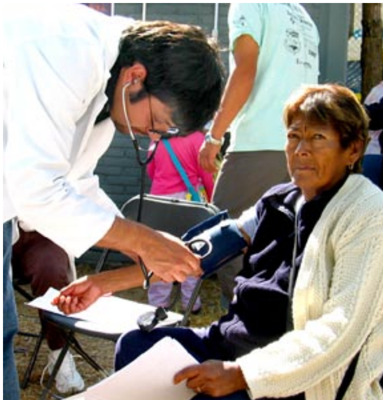
Cuestiona experto la ausencia de médicos y especialistas en el programa oficial de Seguro Popular

Leal Fernández urgió asimismo a enfocar las políticas en la materia en la atención de los grandes problemas de salud del país: desnutrición e incremento de enfermedades crónicas. (Alejandra Pérez y Verónica Ordóñez)