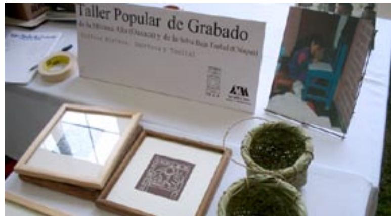
El Taller Popular de Grabado, con carácter itinerante, aglutina talento zapoteco, mixteco y tzeltal

Los alumnos que realizan su servicio social han presentado ante las comunidades los reportes correspondientes de sus prácticas profesionales. Los universitarios están convencidos de que su experiencia puede ser llevada a otras zonas del país.