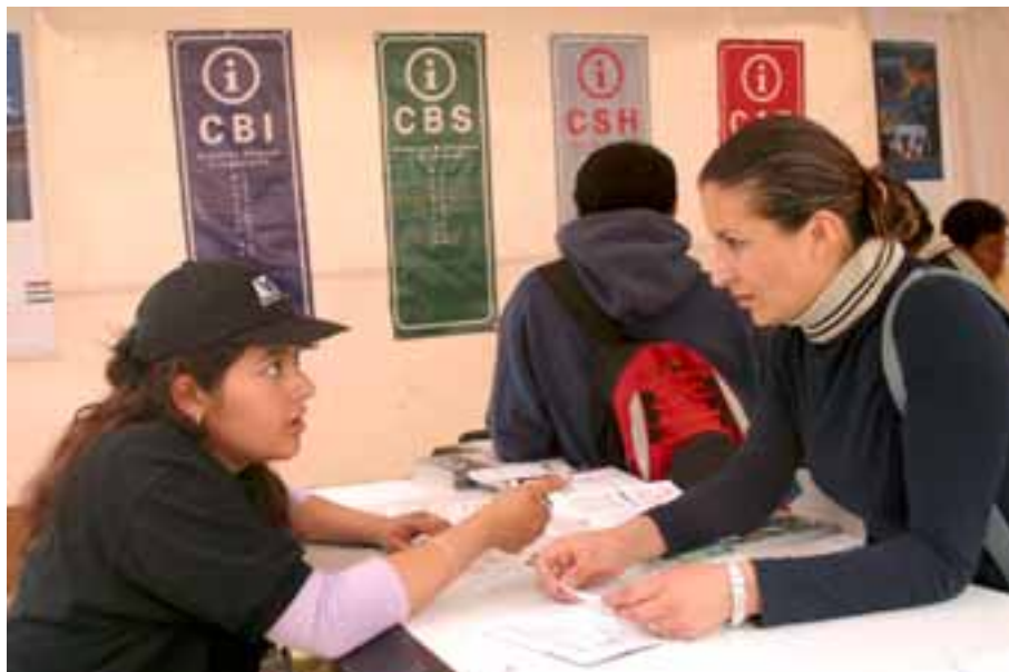
El proceso de inscripción de alumnos de nuevo ingreso se realizará entre el 26 y 29 de abril

Con la publicación de estos resultados, la Universidad concluyó el primer proceso de selección 2004. /De la Redacción